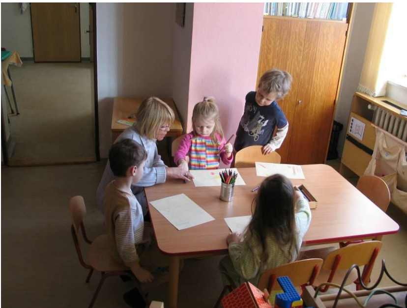
obr. č. 2 – Děti malují