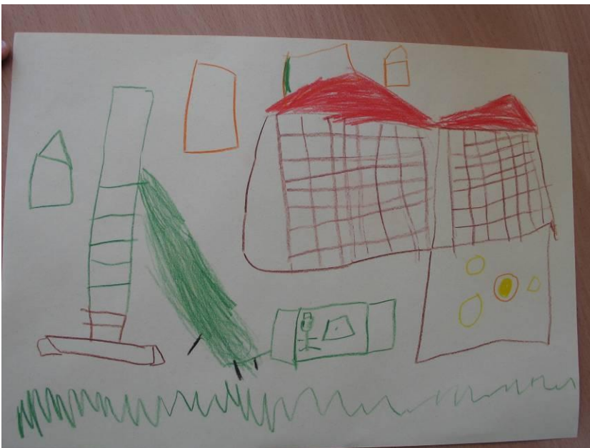
obr. č. 4 - výkresy