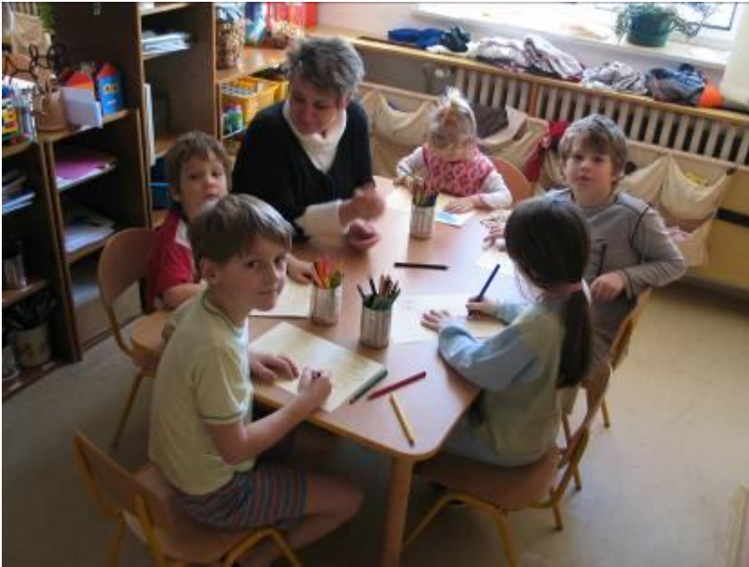
obr. č. 1 – Děti malují