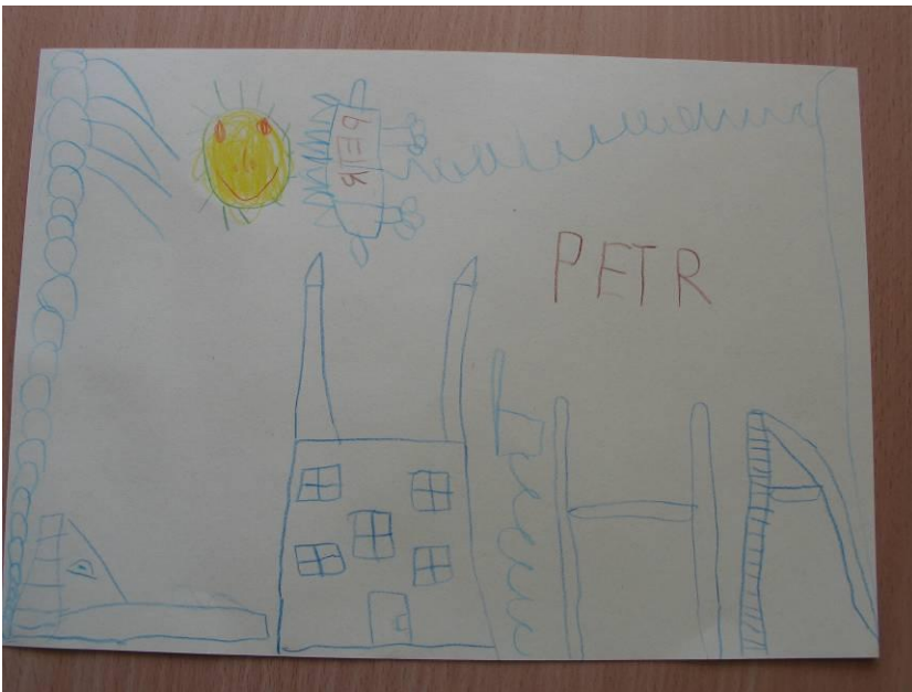
obr. č. 8 - výkresy