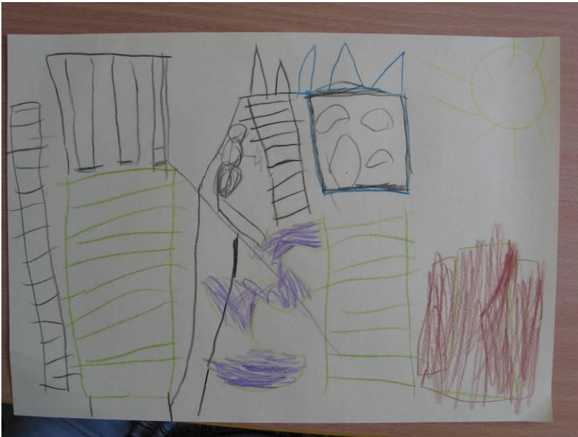
obr. č. 7 – výkresy