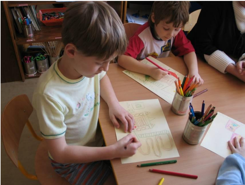
obr. č. 3 – Děti malují