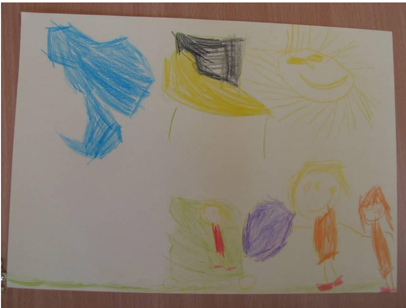
obr. č. 6 - výkresy